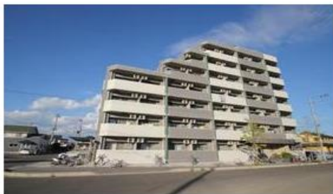
重厚感のあるツートーンカラーのマンション